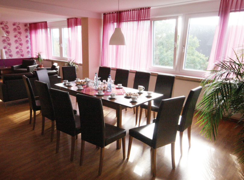
Gemütlicher Gemeinschaftsraum mit Fernsehcke im 3. Obergeschoss