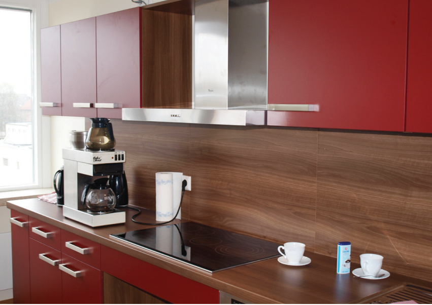
Vollausgestattete Gemeinschaftsküche im 3. Obergeschoss