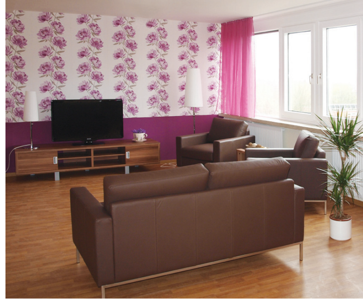
Gemeinschaftliche Fernsehcke im 3. Obergeschoss