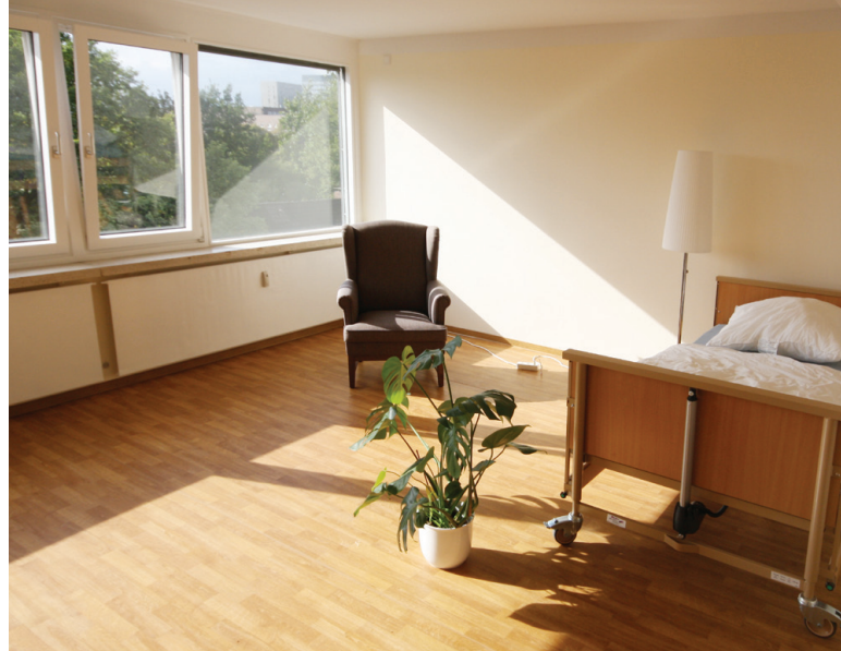
Wohneinheit im 3. Obergeschoss