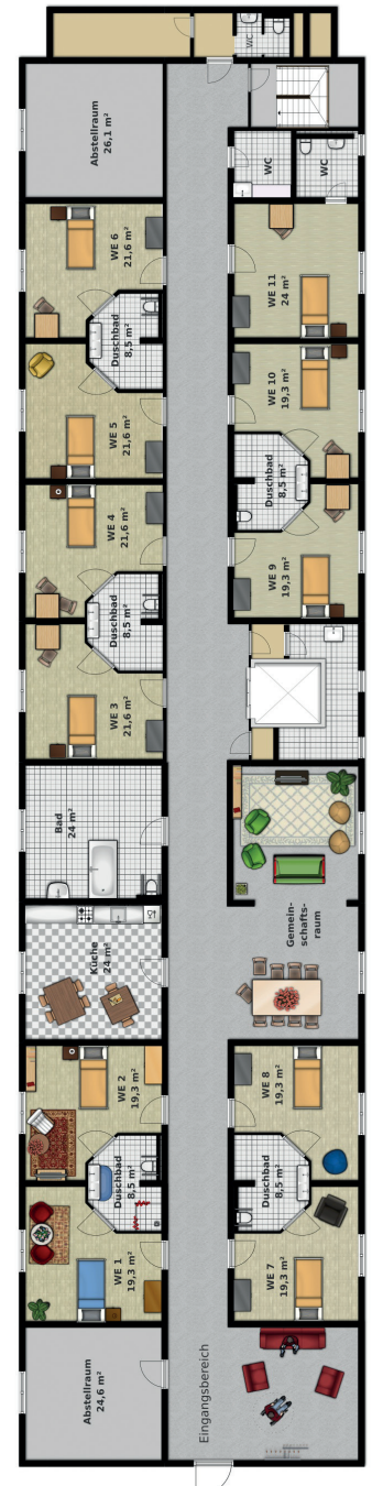
Etagenplan 3. Obergeschoss