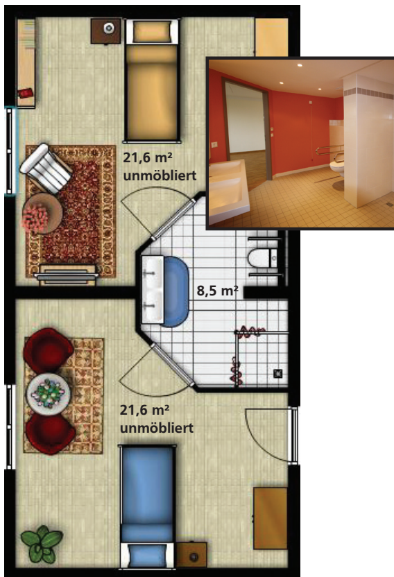
Grundriss Wohneinheit im 3. OG mit Duschbad

Wir beraten die Mieter der Wohneinrichtungen gerne bei der Auswahl von Service- und Dienstleistungsangeboten. Diese können Sie individuell und entsprechend Ihrer persönlichen Bedürfnisse oder gemeinsam innerhalb der Wohngemeinschaft wählen (z.B. Menüservice, Fußpflege, Friseur, Kosmetik oder Physiotherapie).