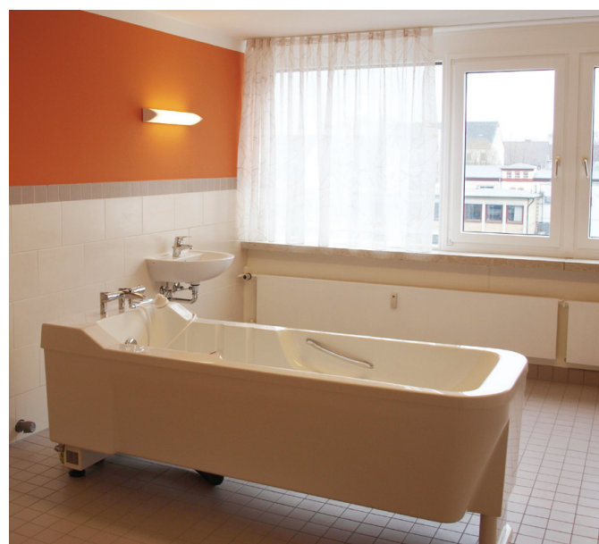
Pflegebad mit Wanne im 3. Obergeschoss